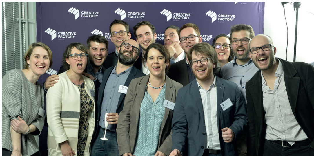
Les lauréats de la saison 3 à l'occasion de la soirée Creative Factory.

Creative Factory Selection est un programme d'accompagnement destiné à booster et accélérer des entreprises de l'industrie culturelle et créative à fort potentiel économique pendant une période de neuf mois.